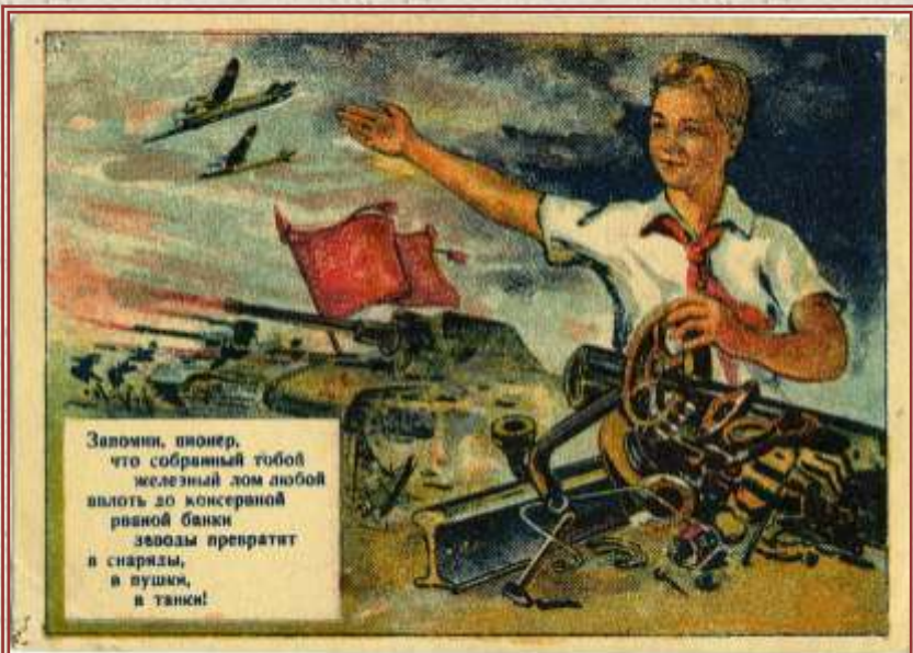
Запомни, пионер, что собранный тобой железный лом любой выльет до консервной банки зловонный препарат в снаряды, в пушки, в танки!

В школах работало 86 клубов художественной самодеятельности, в которых было 1619 учащихся; 17 клубов (381 уч-к) проводились, 11 клубов (220 уч-к) - проводились.