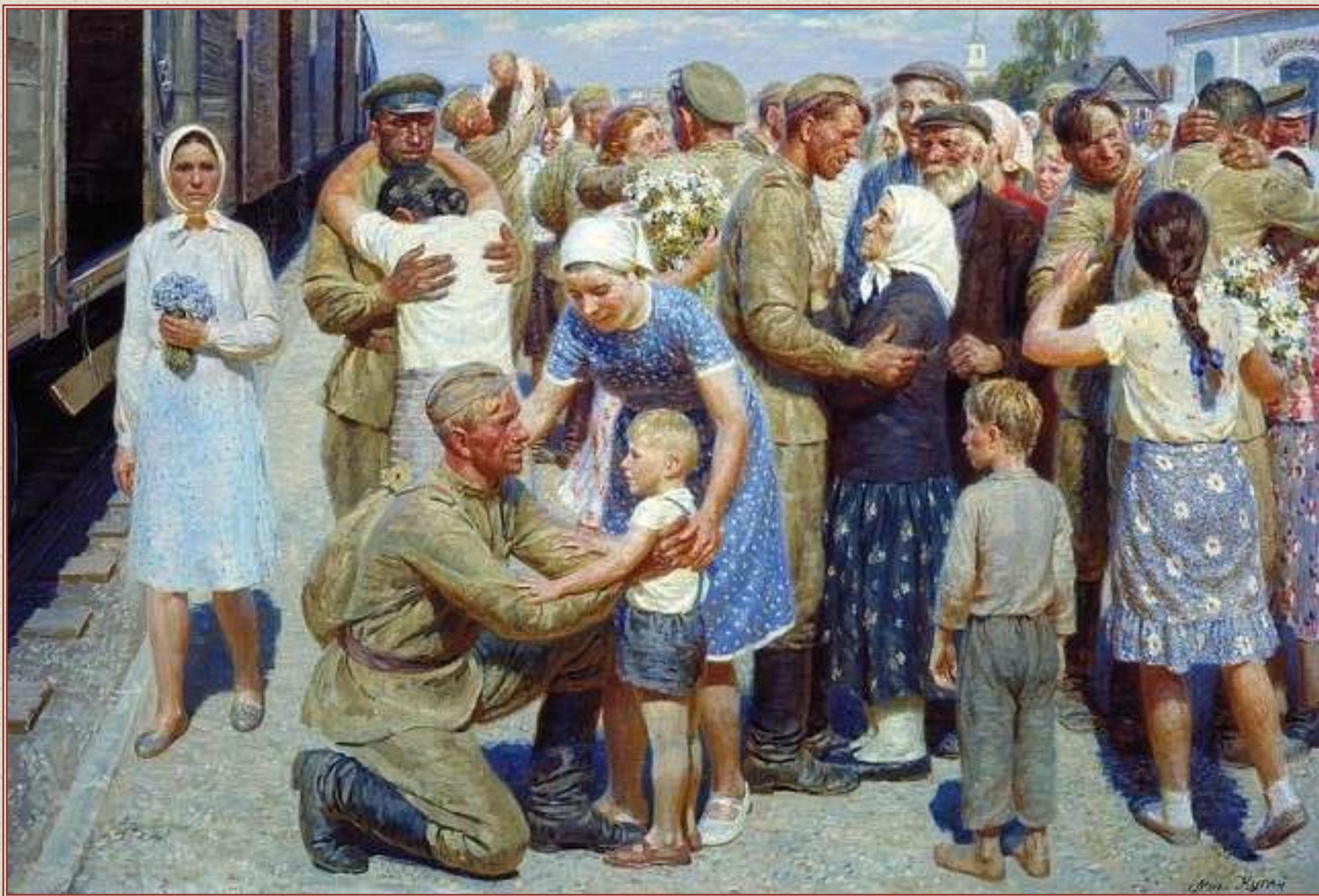
Художник Михаил Кугач "После победы"