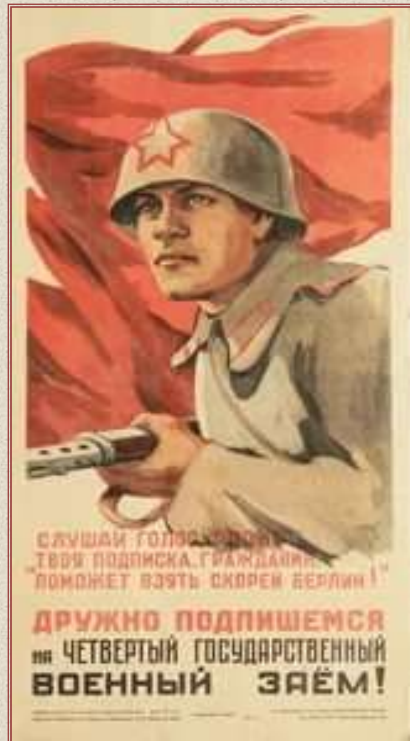
картинки носит иллюстративный характер