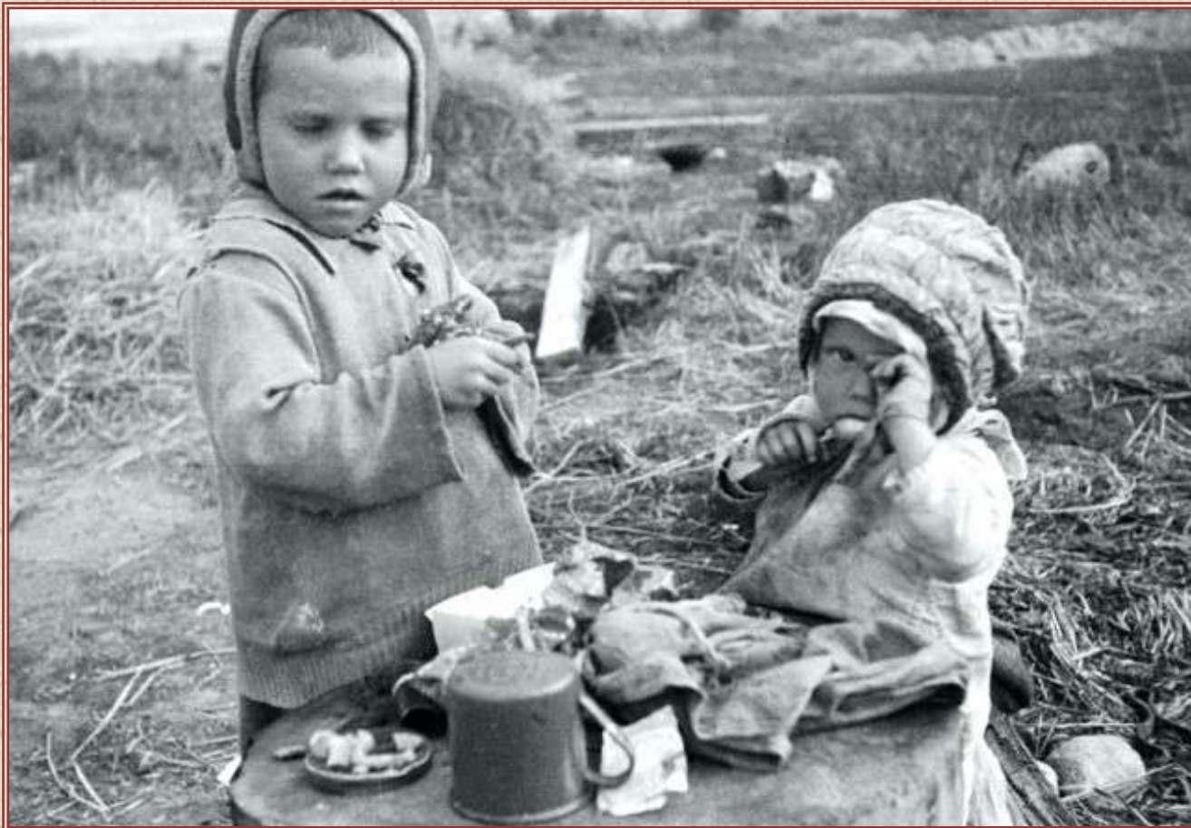
Дети освобожденного белорусского села Мядель. Место съемки: Мядель, Белоруссия. Время съемки: 1944.